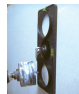
Precyzyjnie wyrównaj szablon przy użyciu poziomic na jego obrzeżu.