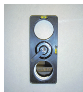
Wywierć kolejny otwór.