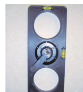
Zamocuj rozporowy szablon