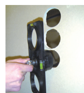
Przetaw szablon dla wywiercenia kolejnych otworów