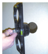
Wywierć otwór centralny